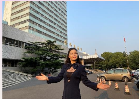
2020 年被邀请为 CCTV3 《星光大道》 月赛评委

周茜常在教学的过程中挖掘歌手的鲜明特点，或是音色，或是咬字，或是气息，或是节奏，放大到成为个性和特点，杜绝了“千人一式，千人一声”。