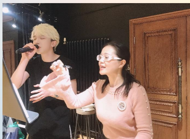
周茜老师在给学生上课