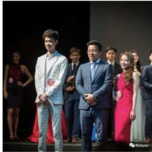
Hansen @ 华谊兄弟时尚—新星盛典 获得世纪影游Century Entertainment签约邀请