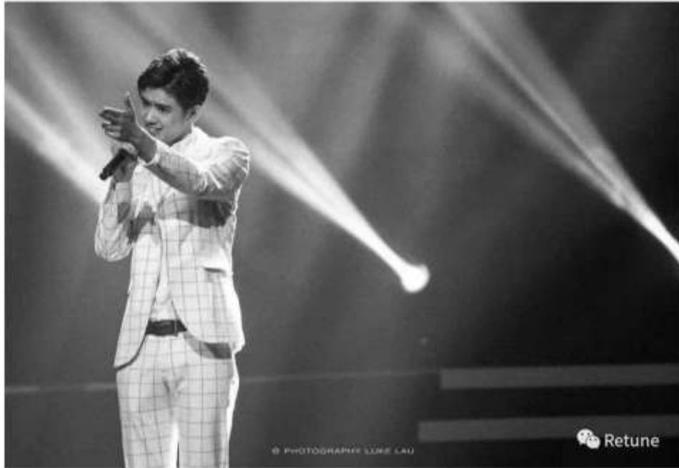
降噪计划 - UTCMC第七届K王争霸赛 决赛

热爱唱歌的他多次参加歌唱比赛，在2018年多大多之声比赛中获得亚军，UTCMC第七届K王争霸赛中晋级决赛，外型帅气的他，在舞台上耀眼夺目，也因此有了“校园爱豆”的称号。他并不止步于此，继续朝着热爱前进，不断尝试，拍摄了多部微电影及网络电视剧，参加了由华谊兄弟时尚举办的新星盛典，并获得世纪影游Century Entertainment签约邀请。